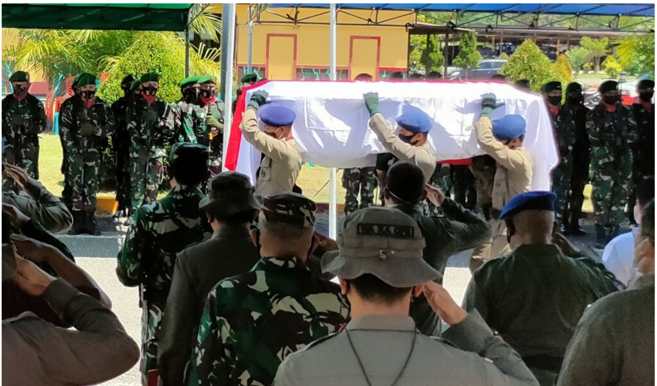
Politieagenten dragen de kist van een van hun officieren die in een vuurgevecht met Papuastrijders is gedood.

Jan van Benthem 8 mei 2021 aangepast 08:07